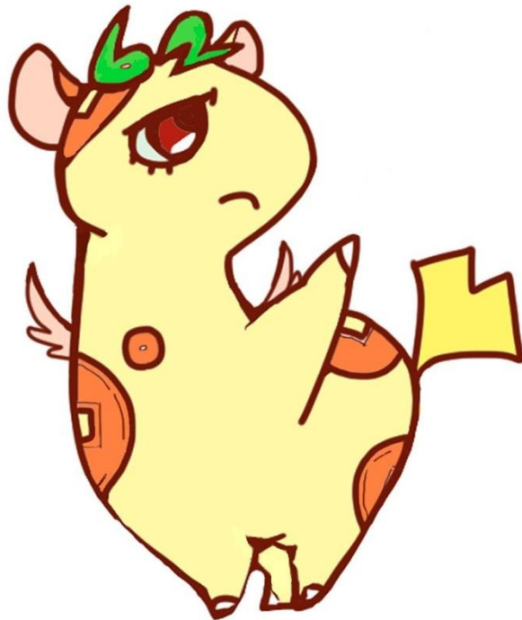
個人住民税PRキャラクター 「ぜいきりん」

東京都と都内全 62 区市町村は、 平成 29 年度から個人住民税の 給与からの特別徴収を徹底します。