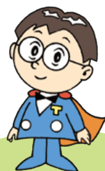
主税局イメージキャラクター タックス・タクちゃん