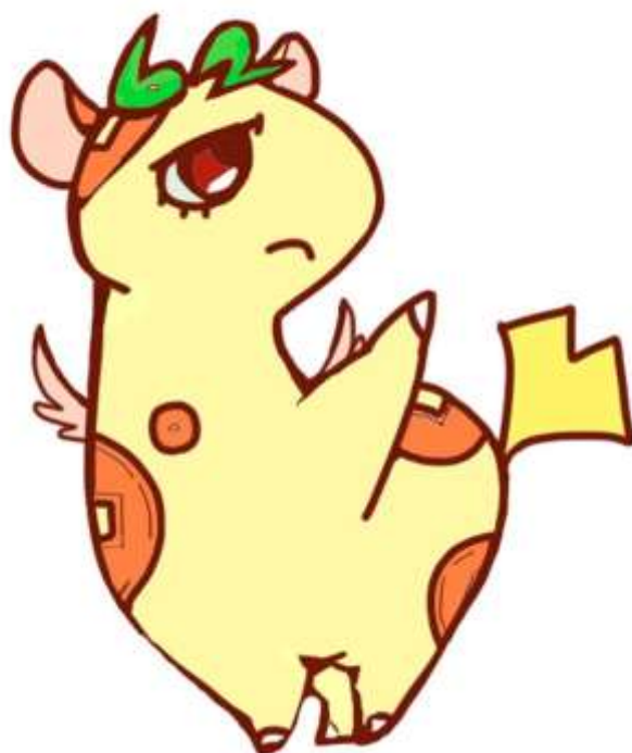
個人住民税PRキャラクター 「ぜいきりん」

東京都と都内全 62 区市町村は、 平成 29 年度から個人住民税の 給与からの特別徴収を徹底します。