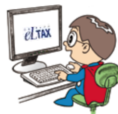
主税局イメージキャラクター タックス・タクちゃん